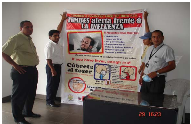
VIGILANCIA EPIDEM. EN AEROPUERTO DE TUMBES