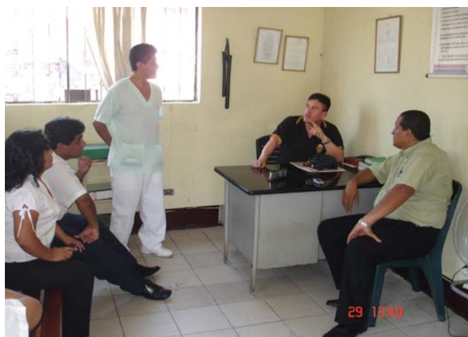
COORDINACIONES EN PUESTO DE CONTROL FRONTERIZO CANAL INTERNACIONAL.