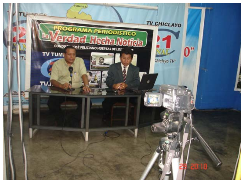
DIFUSION DE MEDIDAS PREVENTIVAS A LA POBLACION