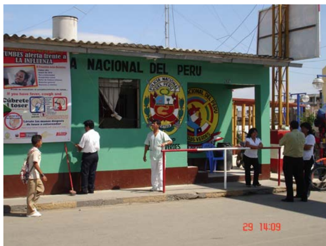
VIGILANCIA EN CANAL INTERNACIONA